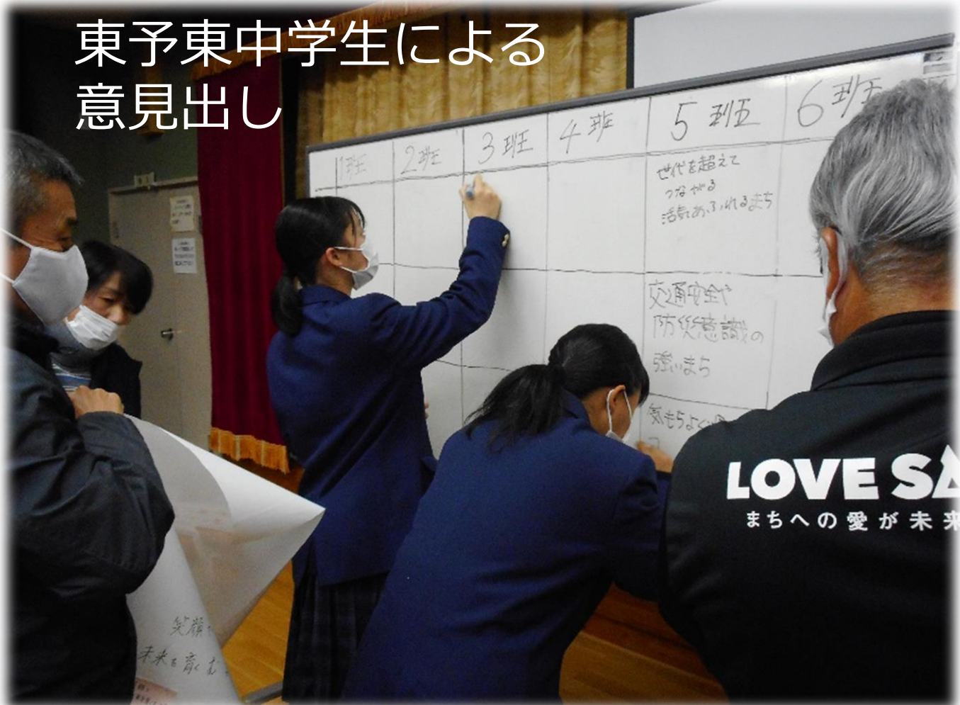
【キャッチコピーと 目指す将来像の叩き台】