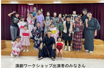
演劇ワークショップ出演者のみなさん