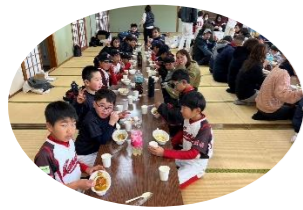
お昼は仲良くカレーをいただきました