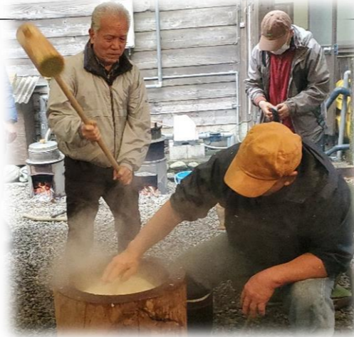
(山の駅7周年を祝う会写真)