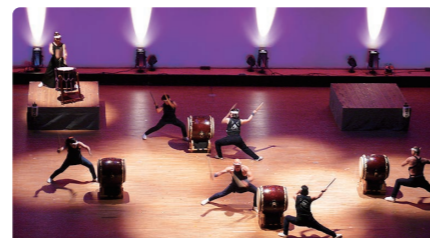
▲結成15周年記念公演の様子

料金 全席自由 1,000円 (当日1,500円) ※未就学児はひざ上鑑賞無料、座席鑑賞は有料 ※丹原・総合文化会館などで入場券販売中 (車椅子席は丹原のみで販売) 場所・問合せ 丹原文化会館