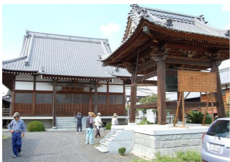
《 周布文化財 》