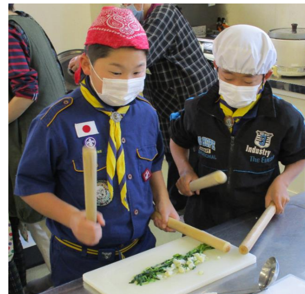
今年の無病息災を願いながらおいしくいただきました。