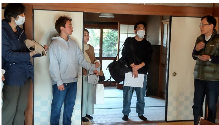
【空き家見学ツアーの様子です（3 軒目）】