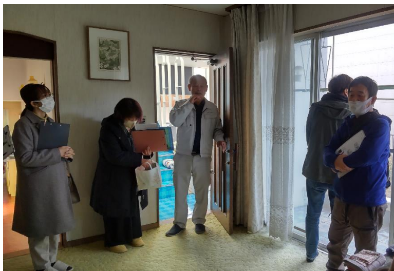
【空き家見学ツアーの様子です（1軒目）】