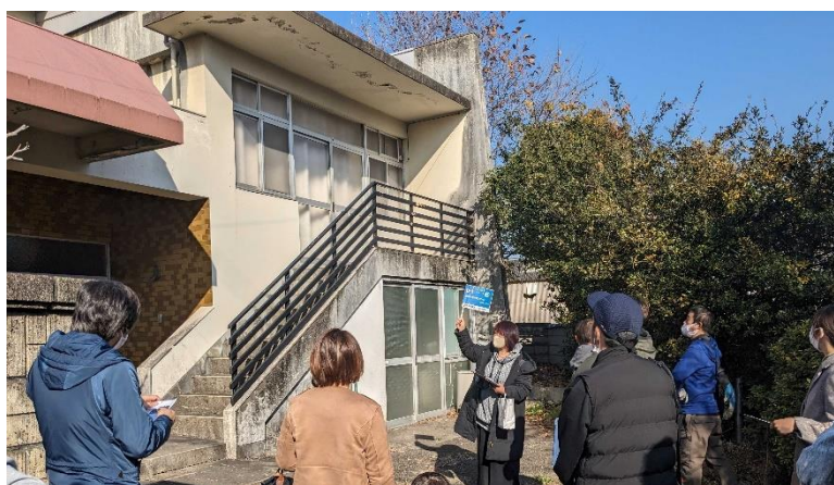
【空き家見学ツアーの様子です（2軒目）】