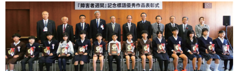
『障害者週間』記念標語優秀作品表彰式