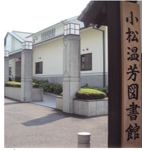
ご協力をお願いします

▼期間 2月1日(木)～7日(水) 小松温芳図書館 Tel.0898-17215634