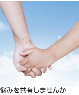
悩みを共有しませんか