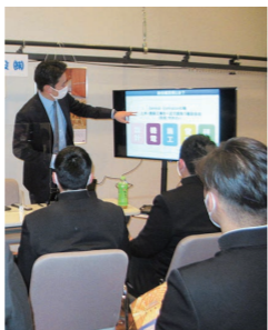
就職活動のきっかけに