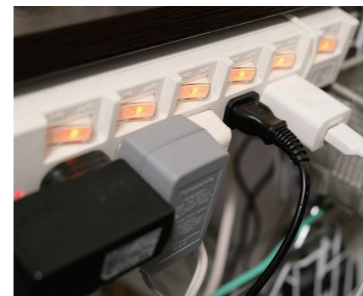
今一度、家庭内の確認を

冷蔵庫の裏などは注意が必要です。普段見えにくいコンセントの接点が増えるのでトラッキング現象につながりやすくなります。 年末年始などで清掃・点検を行い、未然に火災を予防しましょう。