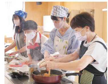
プロから学べる料理教室です