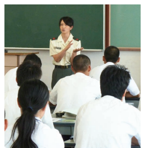
募集説明会も実施中