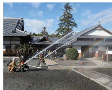
昨年は佛心寺で訓練を実施

1月26日は「文化財防火デー」 昭和24年1月26日に、法隆寺金堂から出火した火災によって、世界的な至宝と言われた金堂の壁十二面に描かれた仏画の大半が焼損しました。その後も貴重な文化財の火災が相次いで発生したことから「文化財防火デー」が定められました。 令和元年には、世界遺産であり、国指定史跡でもある沖縄県那覇市の首里城跡において、正殿などを全焼する大規模な火災が発生し、社会的に大きな衝撃を与えました。貴重な文化財を火災から守るため、西条市においても毎年この時期に文化財所在地で火災防ぎょ訓練を行っています。今年も、西条小学校で訓練を予定しています。