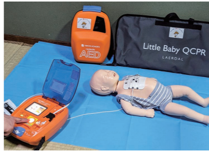
AEDトレーナー・乳幼児用訓練人形