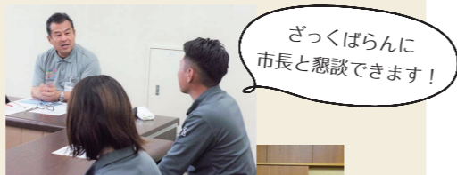
ざっくばらんに市長と懇談できます!