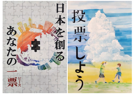
小中高生の力作をぜひご覧ください

▼場所 小松サービスセンター 西条市選挙管理委員会事務局 Tel.0897-52-11263