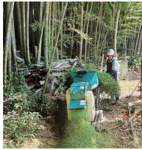
西条の自然を守ろう!