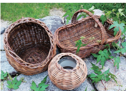
インテリアを彩る花かごを作りませんか