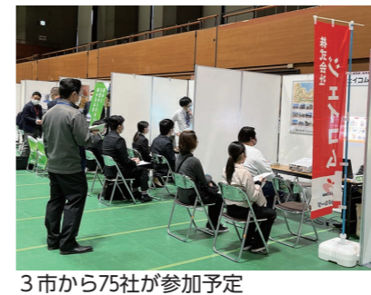
3市から75社が参加予定

高校生対象合同企業説明会の参加企業を募集 ▼対象 市内に主たる事業所があり、就業場所が市内から通勤できる範囲の企業 ▼日時 1月31日(水) 16時30分～18時30分(予定) ▼場所 総合文化会館 ▼内容 高校卒業後に就職を希望する市内外の高校2年生対象の合同企業説明会。参加企業ごとにブースあり。 ▼募集企業数 約42社(抽選制) ▼申込方法 市ホームページの申込フォームから。 ▼申込期間 12月4日(月)～8日(金) ☎市庁舎新館2階産業振興課 Tel.0897-52-11482