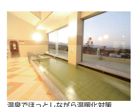
温泉でほっ！としながら温暖化対策