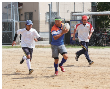
優秀な成績を収めた方を募集