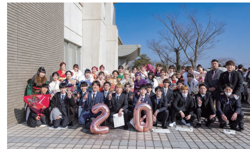
思い出に残る二十歳の集いを