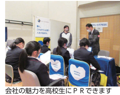
会社の魅力を高校生にPRできます