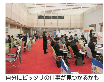
自分にピッタリの仕事が見つかるかも

シゴト発見フェス in 愛媛 対象 2025年・2024年3月卒業予定の学生、既卒3年以内の求職者の方 日時 1月6日（土） 10時～15時30分 場所 愛媛県民文化会館（松山市道後町） 内容 県内52社が参加予定。ツアー・データ・適性診断・動画・セミナーであなたにピッタリの企業を見つける合同説明会。 申込方法 専用ホームページの申込フォームから。 問合せ 西条市役所 就業支援課 TEL 0899-191318685 詳細は