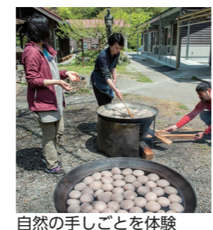
自然の手しごとを体験

が保険医療を受けた場合、自己負担するべき費用（1～3割）の一部を助成します。該当者に受給者証を交付しますので、担当課で申請してください。印鑑はスタンプ印でないものをお持ちください。 市庁舎新館1階国保医療課 TEL 0897-1521121 西部支所 市民福祉課