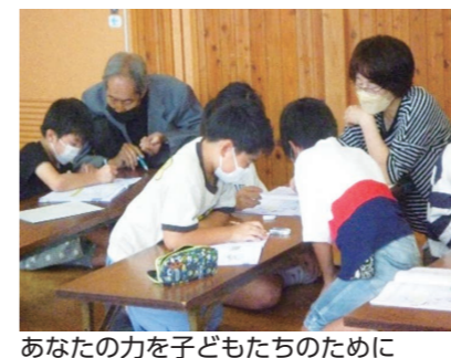
あなたの力を子どもたちのために

新居浜産業技術専門学校 令和6年度 中期入校生募集中 ▼対象 高等学校卒業以上 ▼募集科目 ○メカトロニクス科 ○機械・保全・電気技術者 ○自動車整備科 ○2級自動車整備士 ○メタル技術科 ○溶接・金属加工技術者 ※どの科目も2年間の課程 ▼募集期間 11月13日(月)～12月8日(金) ▼費用 2200円 ○選考料 9900円(月額) ○授業料 9900円(月額) ☎新居浜産業技術専門学校 Tel.0897-4314123