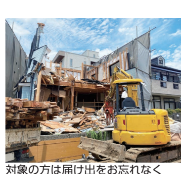
対象の方は届け出をお忘れなく