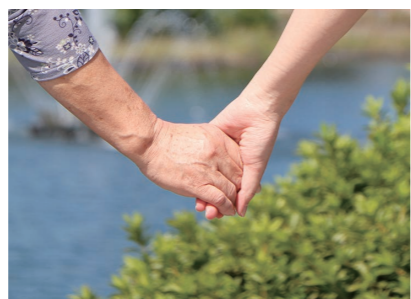
当事者の立場で考えてみよう