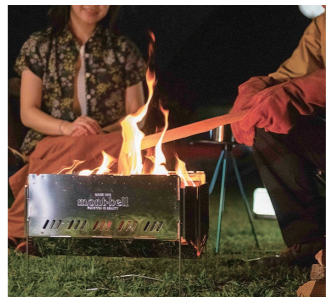
夜の焚き火に癒やされよう