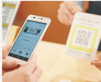
「SDGs×DX」による持続可能なまち西条推進事業