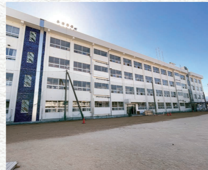
小学校施設長寿命化事業