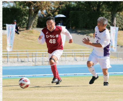
ねんりんピック開催事業