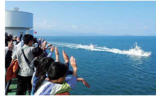
海上保安庁による巡視船パレード

10月28日、4年ぶりに「西条市研修の船」を開催。市内小学3年生と保護者合わせて約400人が、オレンジフェリーで体験航海を行いました。操舵室見学や、救命ボート展張、出前講座、クイズ大会などを体験。大きな船で楽しく学ぶ親子の姿が見られました。