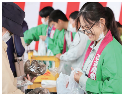
西条農業生が作った農作物の販売は大盛況

11月11日、西条市産業祭が西条農業高校で開催。高校生による農業学習展や、各種団体の産業展・文化展、即売などが行われました。久々の開催に、展示に見入る人や地元産品を買い求める人など、多くの人々ににぎわいました。