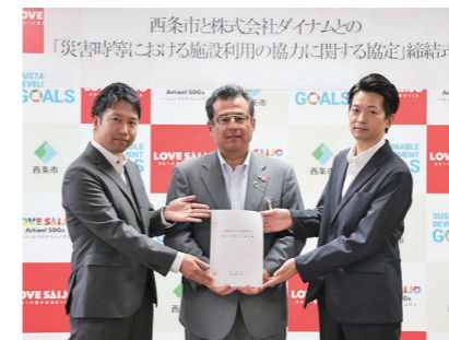
西条店(左)と東予店(右)のストアマネジャー

10月27日、(株)ダイナムと「災害時等における施設利用の協力に関する協定」を締結。この協定で、施設の駐車場を一時避難所、救援隊などの一時的な集結場所として使用することや、施設のトイレなども利用可能になります。