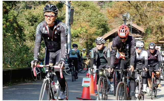
ロングコース88km、ハーフコース60kmの2コースで実施

11月5日、西条西部公園を主会場に、いしづち山麓SWEETライドを開催。県内外から約700人のサイクリストが訪れ、市内の美しい景色を楽しめるコースを快走しました。休憩場所では、西条自慢の数々の食事を満喫し、笑顔があふれていました。