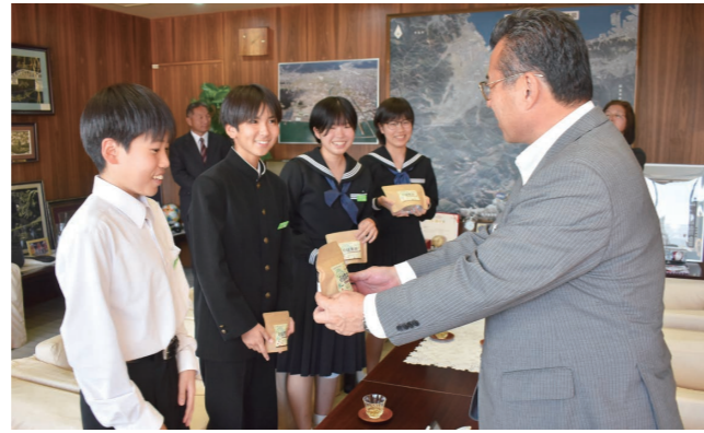
完成した石鎚黒茶を市長に手渡し生徒たち

11月1日、障害者事業所ピースと一緒に石鎚黒茶製造作業に協力した西条西中学校2年生が市役所を訪問。生徒は国の重要無形民俗文化財に指定されている製造技術の体験談を話したほか、「この取り組みを後輩達にも伝えていきたい」と今後の思いも述べました。