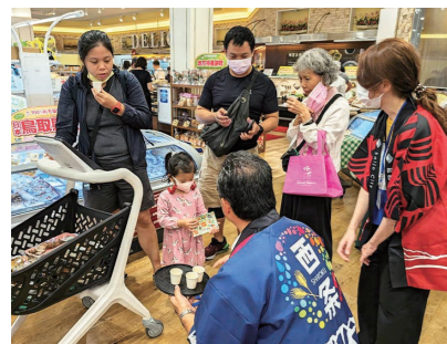
来店者へ西条産品を売り込み

11月11日・12日の2日間、台湾の高級スーパー裕毛屋(台中市)で市内事業者の加工品を販売する西条フェアを実施。12日には、市長が店頭で立ってトップセールスを行い、西条産品や観光のPRを行いました。