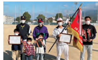
大町校区(右)・玉津校区(左)の皆さん