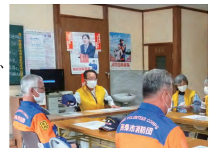
庄内地区避難訓練の打ち合わせの様子

そして庄内連合自治会においても自主防災組織を立ち上げ、地域住民が一体感を持って、工夫を重ねながら前向きに取り組んでいきたいと考えています。