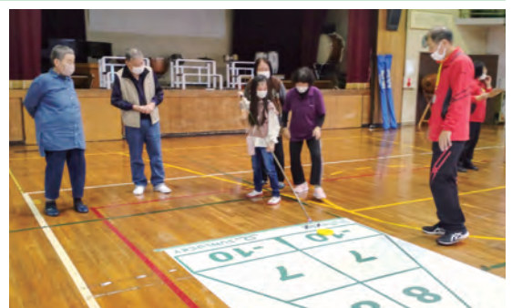
地域のみんでシャフルボードに挑戦！