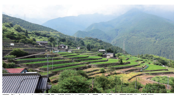
西条市にある千町棚田は国内最大級の石積み棚田