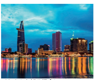
ベトナムを知る機会に

▼申込期間 10月2日(月)~20日(金) ※専門的な語学講座ではあり ません ■国際交流協会事務局 (SAIJO BASE内) Tel.0897-166-9990