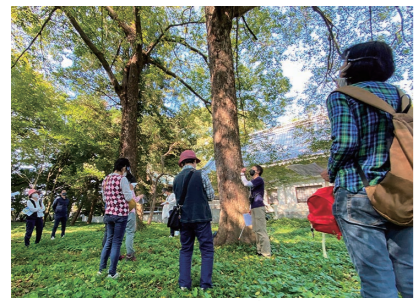
古くから存在するシンボルを観察