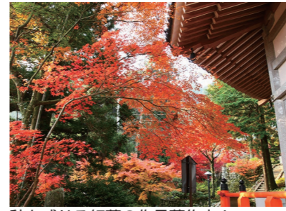
秋を感じる紅葉の作品募集中!

▼募集作品 (部門) 市内の紅葉を題材とした作品 (絵画・写真・書・立体作品・その他) ※応募者本人が作成し、未発表のもの。作品は一人3点まで ※絵画・書は額装または軸装、写真 (A4サイズ以上) は額装または台紙に貼った状態であること ▼募集期間 11月25日(土)10時～12月5日(火)17時 ※作品は12月12日(火)～21日(木)に丹原文化会館で展示 ▼応募料 1点500円 ※作品提出時に支払い。郵送で提出する場合は振り込み 丹原文化会館 Tel.0898-68-13555