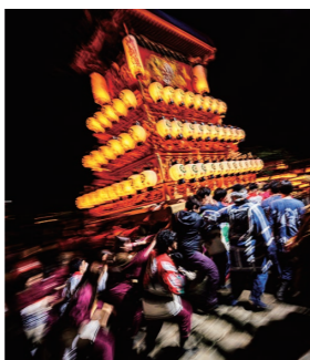
昨年の大賞「駆け上げれ」

令和5年に催される西条市内の秋まつりをアピールするもの（だんじり・みこし・太鼓台・獅子舞・奴など）