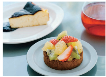
人気スイーツをお楽しみください