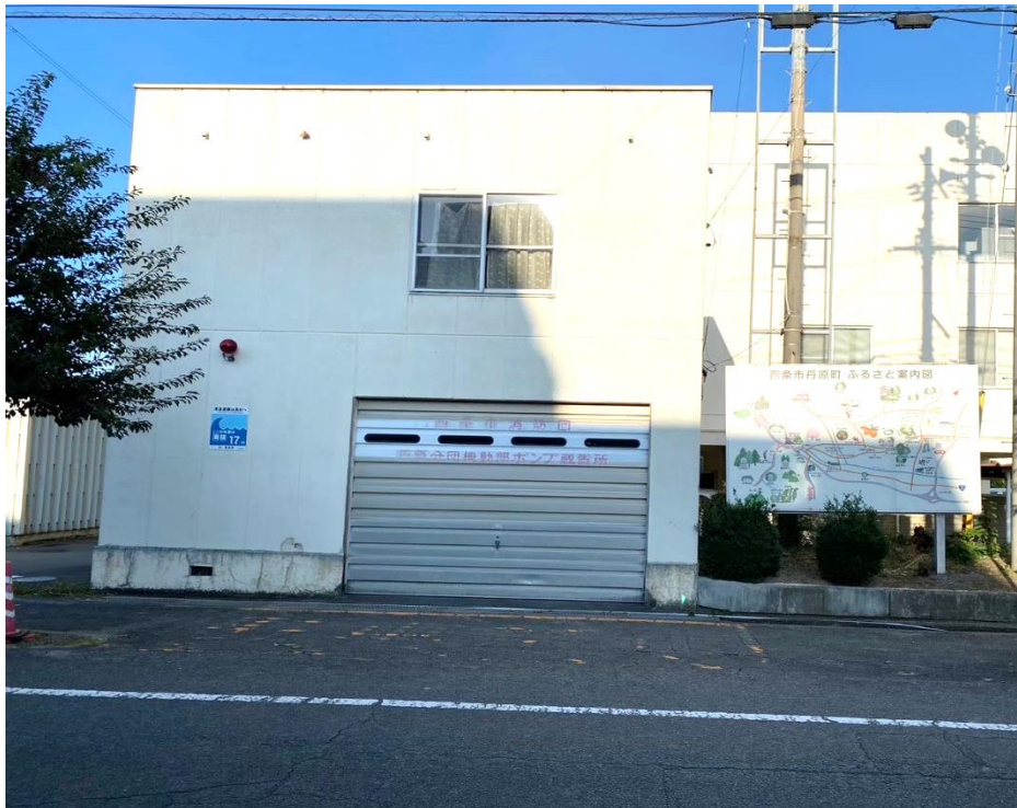
【解体建物現況写真】