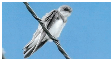
ショウドウツバメ（旅鳥）

全長12.5cm、ツバメより一回り小さい灰褐色のツバメです。夏鳥として渡来し北海道で繁殖していますが、四国では春と秋の渡りの季節に旅鳥として通過しています。褐色の背面と白い胸にあるT字形の黒帯が他のツバメとの識別点。西条では主に秋の渡りの季節に山地の高圧電線や広い水田地帯の電線に止まって休憩しているところが見られます。