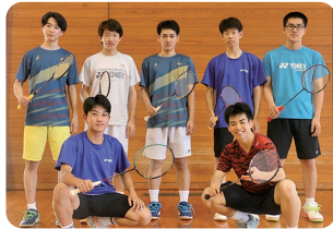
男子バドミントン部の皆さん。来年の2月にある高校最後の県選手権大会に向けて、日々練習に励みます

最後の総体で力を出し切ることができて良かったです。現在もバドミントンを続けながら、土木関係の職業に就くことを目標に、合同企業説明会などにも参加し、就職活動がんばっています。残りの高校生活、体育祭など学校行事もいくつか残っているので、悔いのないように全力で楽しみたいです。