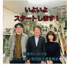
西条市における コミュニティ財団設立準備委員会 四国初となるコミュニティ財団 「公益財団法人えひめ西条つながり基金」を発足