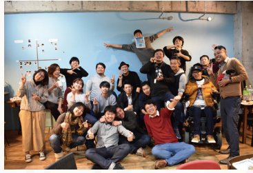
西条市の地域おこし協力隊として赴任・移住し 行った「ローカルベンチャー誘致・育成事業」