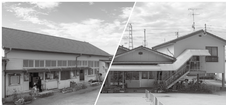
老朽化により建て替えが計画されている社会福祉法人青葉会みどり保育園(右)と社会福祉法人清心会 花園保育園(左)

A 安全対策については、児童保育施設の建設基準を満たしており、障害のある子どもなどへの配慮からエレベーターの設置を予定している。2階からの避難経路については、建物内の階段のほか、外階段を設けるため2か所確保できている。