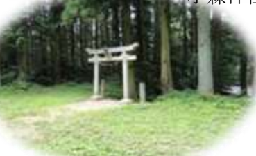
小森神社は今でもきれいに手入れされていて毎年お祭りには大勢の人で賑わいます

この道はかつて生活道として人々が往来していました。氷見から黒瀬峠、大保木、前田峠を經由して東之川シラサ峠を越えて寺川へとつながっていました。前田集落は30戸ほどの家々で昭和20年頃は黒茶を作っていたそうですが山はスギやヒノキの植林で茶畑が急激に減っていったそうです。