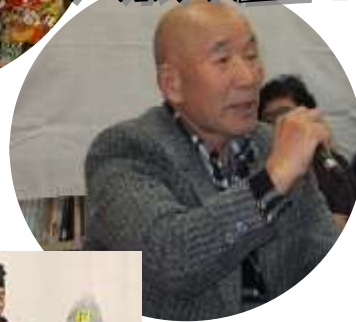
自慢のカラオケ 披露