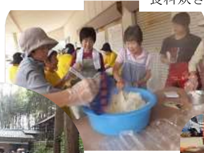
食料炊き出し訓練