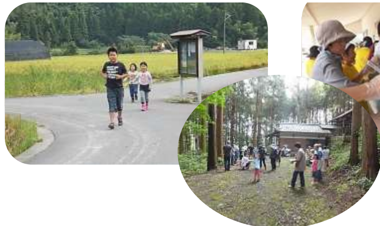
自宅から津波に備え住民約50人が訓練で高台、松岡神社に避難しました