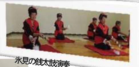
氷見の銭太鼓演奏