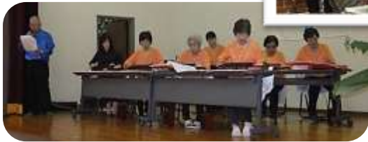
秋山教室大正琴グループによる演奏