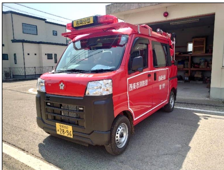
小型動力ポンプ積載車