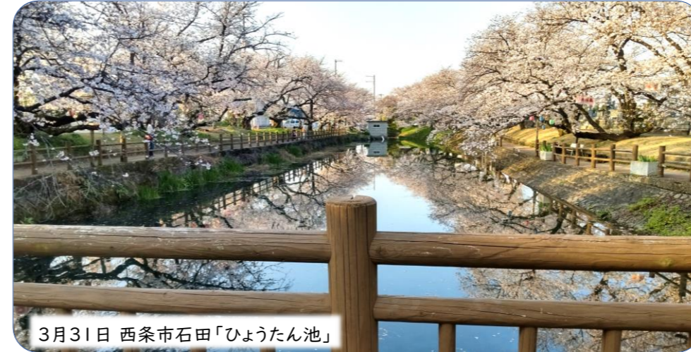
3月31日 西条市石田「ひょうたん池」

今年もひょうたん池の桜がきれいに咲きました。県内外の方やメディアからの問い合わせもあり、水面に写る桜や夜桜を多くの人を楽しみました。