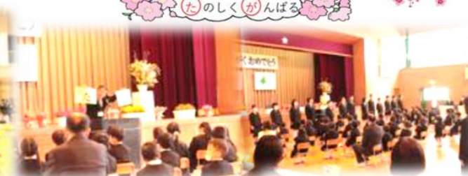
▲4/10に、ピカピカの一年生51名が入学しました。