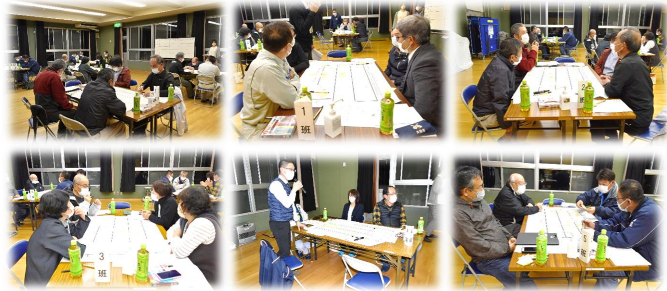
▲各グループ討議の様子(課題抽出と意見のまとめ、大変ですが、美しいまちづくりに向け頑張ってます)👏

24名の皆さん活発に意見を出し合い、様々な課題について今すぐ取り組む内容から将来に向けて取り組む内容を討議しました。