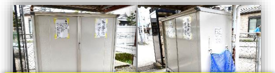
・自転車置き場横の拠点回収ボックス