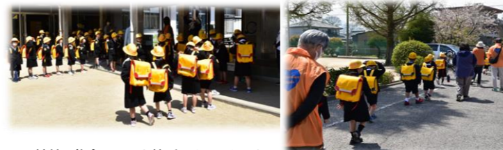
▲下校前の集合ちゃんと整列できてえらいね！

平成17年に発足した「た・ガーディアン・エンジェルズ」新1年生の下校を小学校先生方、愛護班、地域の方で見守り育てる環境が整備され、素敵な多賀に成長しつつありますね。引き続き地域の方のご協力宜しくお願い致します。