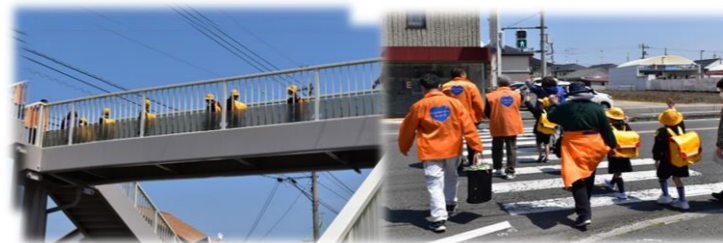
▲交通量の多い道路は、のぼるの大変だけども歩道橋がわたりやすそうね！