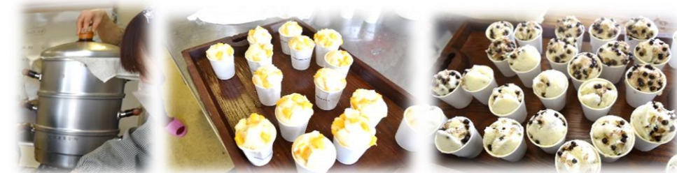
▲生地を入れたらトッピング材料をいれぬいこのせて...

◀蒸したら出来上がり、！（^^）！ すごくおいしい蒸しパンが出来上がり、子供たちも大満足！、笑顔が絶えないイベントとなりました。 参加された皆さんお疲れ様でした。