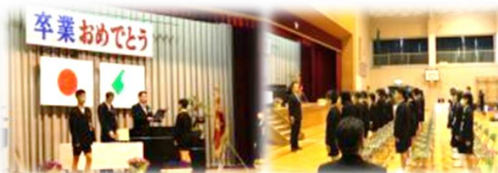
▲3/24に、50名が元よく巣立ちました。