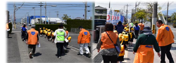
▲一列に整列して下校途中。大きな道路沿いは黄色いラインより道路側は歩かないよう注意しましょうね！子供たち皆ルールを守れてすばらしい！