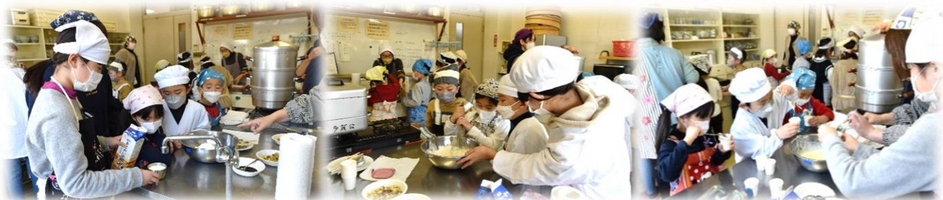
▲量を間違えないように！計量カップで牛乳・砂糖等を計りをベーキングパウダー・薄力粉に加え、皆で協力しながら慎重に混ぜ合わせてます（全集中！）

当日は多くの子供たちが参加、にぎやかな中でカップ蒸しパン作りに挑戦！、さて出来上がりは、？