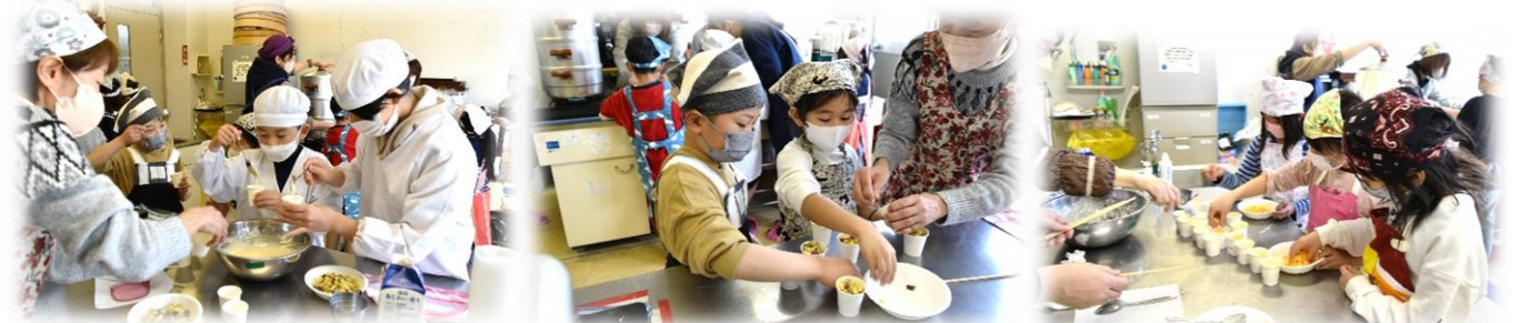
▲皆で混ぜた生地をカップに慎重にいれてます。