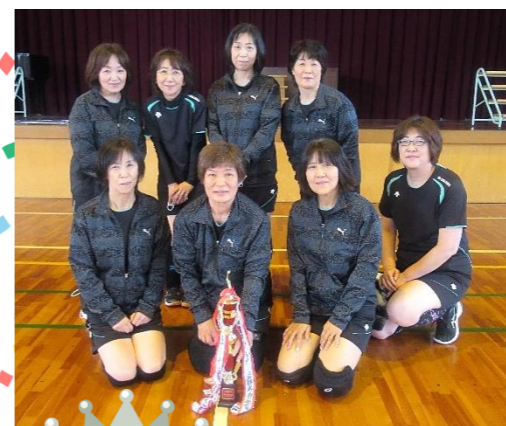
準優勝 すいとぴー