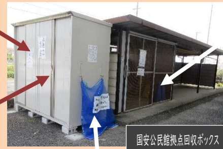
国安公民館拠点回収ボックス

今までどおり月に1回、資源ごみを出していたごみステーションに出すことができます。追加で、国安公民館(東側)には、資源ごみの拠点回収場所として拠点回収ボックスが設置されています。公民館開館日の9時から16時まで出すことができますので、きちんと分別をしてください。 ※びん及びスプレー缶は今までどおり資源ごみステーションでの回収のみ