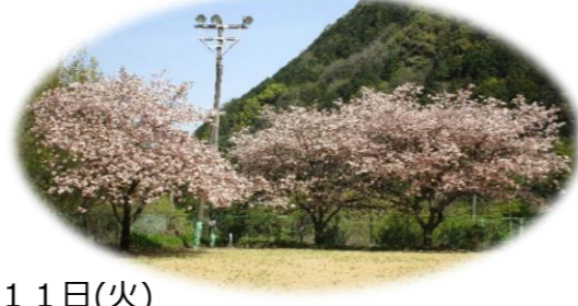
4月11日(火) グラウンドの八重桜が満開を迎えました。