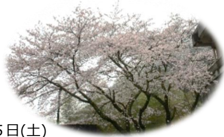
3月25日(土) 公民館北側(調理室前)の桜が満開を迎えました。

さわやかな風が心地よい季節となりました。 みなさん体調など崩されていないでしょうか。