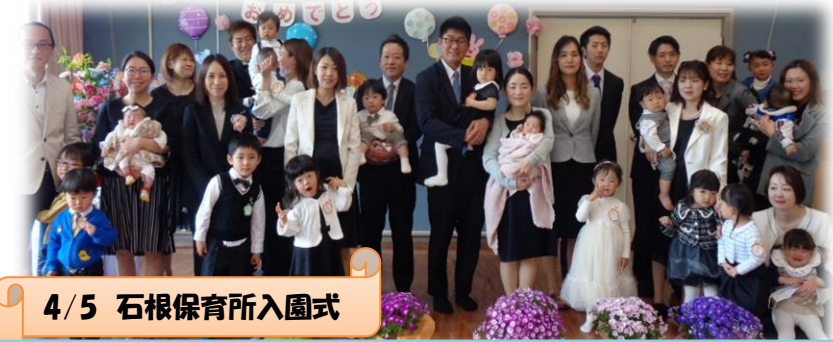
4/5 石根保育所入園式