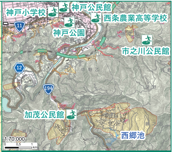
広域図(近隣の緊急避難場所 兼 避難所)