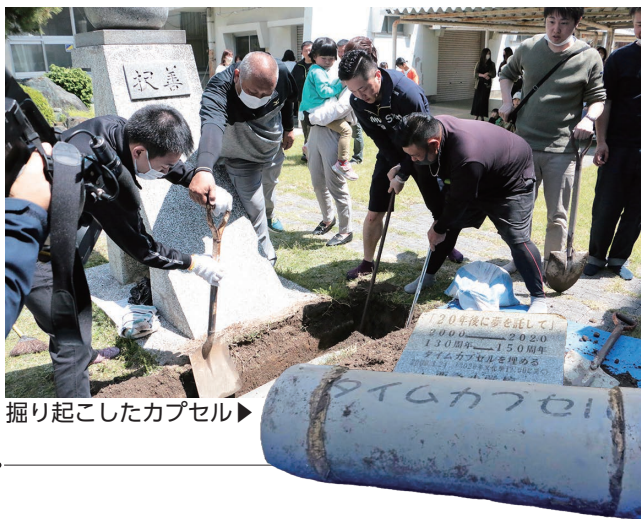
掘り起こしたカプセル▶

5月4日、2000年に西条小学校130周年記念で埋められたタイムカプセルが開封され、当時の先生や児童など150人以上が集まりました。当時小学生だった皆さんも今では30～36歳。小学生の自分からの23年越しの手紙を受け取り、旧友との再会を喜び合いました。