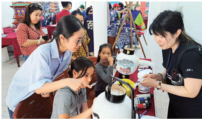
提灯への絵書きなど、西条の伝統文化を体験