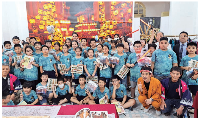
地元の小学生も来場し、大型写真パネルの前で記念撮影