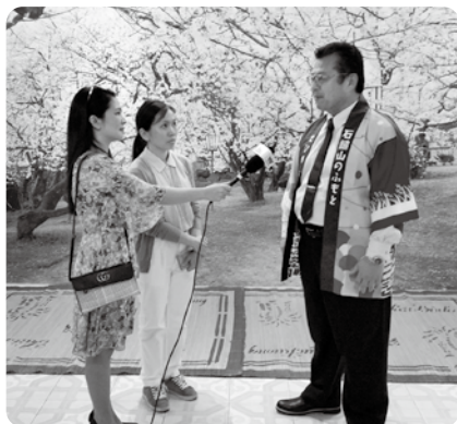
2019フエ伝統工芸フェスティバル

A これまでは、本市の観光名所などの紹介及び日本文化の体験をテーマとして、2013年から4回出展してきた。令和5年度は、テーマを西条まつりに絞ってPRすることとし、だんじり彫刻の実演や体験、ちよんちんの展示や絵描き体験、パネルやミニチュアだんじりの展示などを行う予定である。