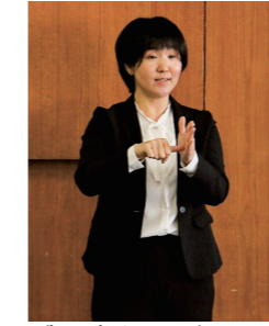
ぜひご利用ください

お知らせ LOVE SAJO ポイント1%還元再開 LOVESAJIJOポイント取扱店でポイントアプリやポイントカードを使ってお買い物などをすると、取扱店の協力により、支払い総額の1%が還元されます。LOVESAJIJOポイントでまちを元気にしよう！ ▼還元ポイント 支払い総額の1% ※LOVESAJIJOポイントカードとプレリー（アプリ）は併用できません ※利用登録がないポイントカードは利用不可。カード配布時にお渡しした利用者登録用紙に記入し必要書類を同封して送付するか、問合せ先にご相談ください ☎LOVESAJIJOポイント相談窓口 Tel.0897-66-19852