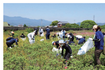
外来種植物を除去し在来生物を守ろう