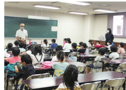
さまざまな言語に親しんでみよう