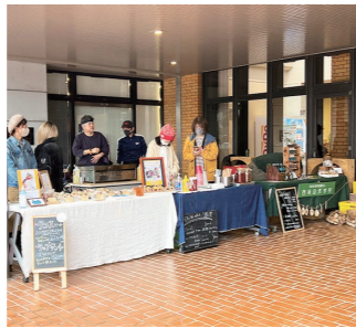
イベントが盛りだくさん!