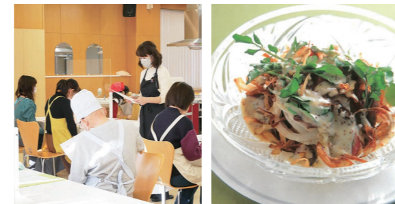
いつも大人気の料理教室 玉ねぎと牛肉のサラダ