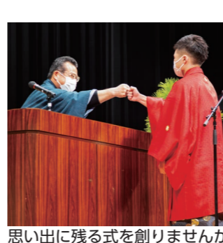
思い出に残る式を創りませんか

令和6年二十歳の集い(旧成人式)の実行委員を募集します ▼対象 平成15年4月2日～平成16年4月1日生まれで、来年の二十歳の集いに出席予定の方 ※実行委員会を2回程度開催 ※民法改正により成人年齢は18歳となりましたが、当市では式典の対象年齢は20歳としています ▼申込期限 6月30日(金) ▼二十歳の集いの開催日 令和6年1月7日(日) ▼会場・開式時間 ○西条地域の方 総合文化会館 10時30分 ○東予・丹原・小松地域の方 丹原文化会館 13時30分 〒市庁舎新館4階社会教育課 Tel.0897-52-11254