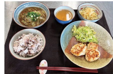
栄養バランスの取れた食生活を