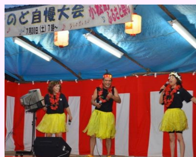
のど自慢 去年は、こんな パフォーマンスも!