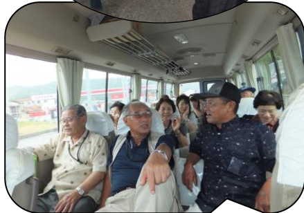
外はあいにくの雨でも、バスの中は明るい笑い声が一杯でした。