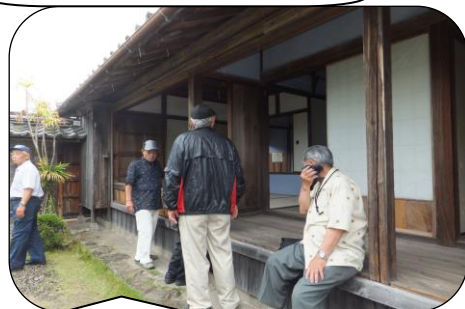
土居廓中の武家屋敷では、当時の生活に思いを巡らせました。