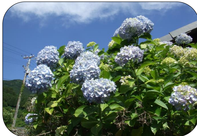
“あじさい”