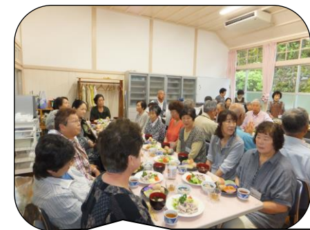
おしゃべりを楽しみながら、美味しい昼食をいただきました。

楽しい企画をたくさん準備して下さった大保木のみなさん、ありがとうございました。来年は、加茂でお待ちしています。