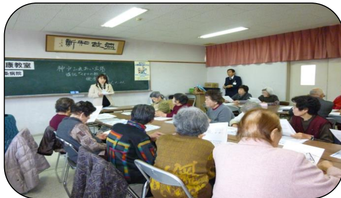
済生会医師による、薬の飲み方講座が開かれました。 皆さん熱心に耳を傾けていました。