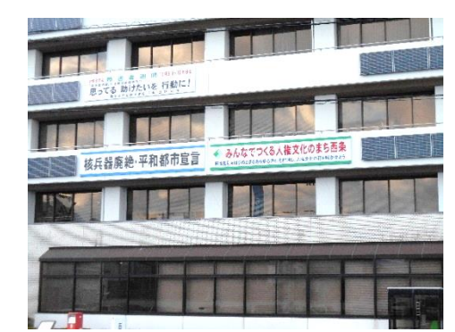
【市役所本庁舎に掲げられた大看板～「みんなでつくる人権文化のまち西条」】