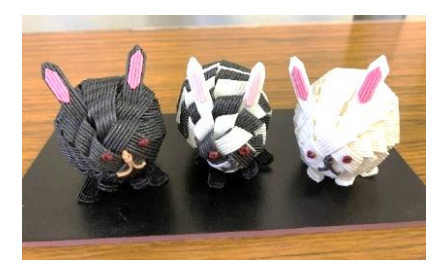
2023 会館マスコット「うさファミリー」 (クラフトサークルさんより寄贈) (左から)うさパパ、うさこ、うさママです。 みなさん、よろしくね♪