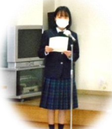
人権に関する作文：それぞれの思いをそれぞれの言葉で・・・