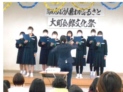
西条南中合唱部の美しい歌声で幕開け