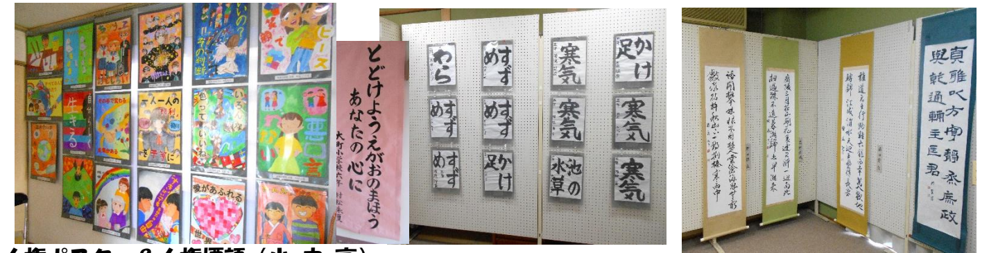
人権ポスター&人権標語（小・中・高）

下面是、『再開&再会♡会館文化祭』催しの様子です。わずかではありますが、どうぞご覧ください。