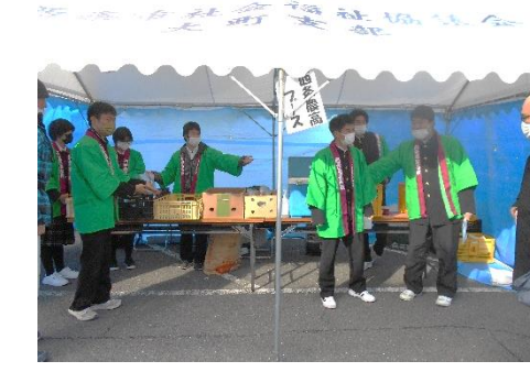
西条農高生による 野菜・花・加工品などの販売