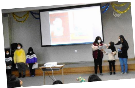
子ども会のメンバーが元気に発表してくれました