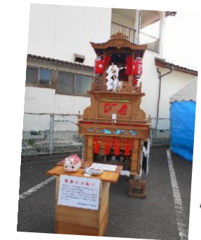
募金への協力、 有難うございました！