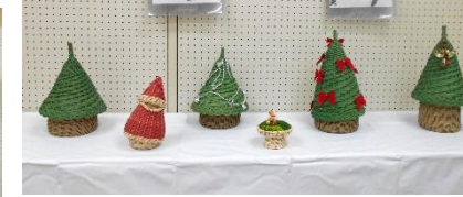
サークル生による作品展示 力作がずらりと・・・♡