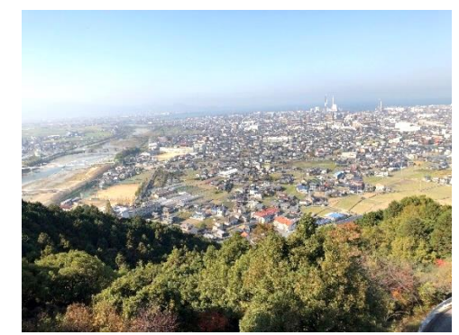
【八堂山(考古歴史館)から西条市を望む】