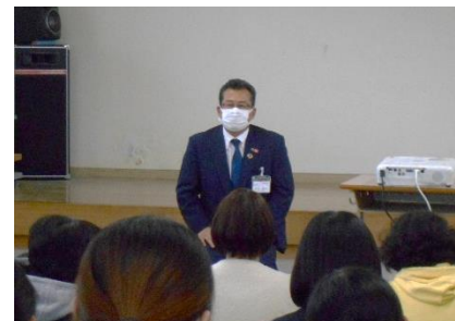
お忙しい中、玉井市長がご臨席 くださいました