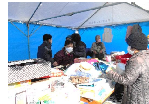
のみの市 いいもの見つかったかな？