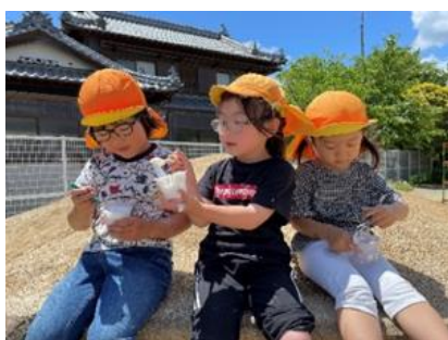
シャボン玉あそび