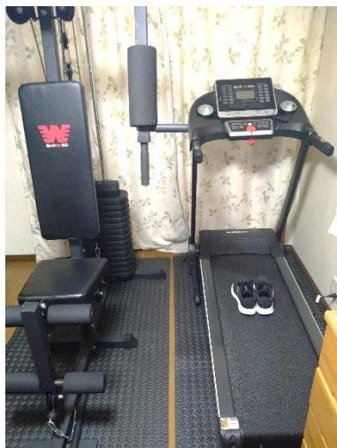
ウォーキングマシン・筋トレマシン