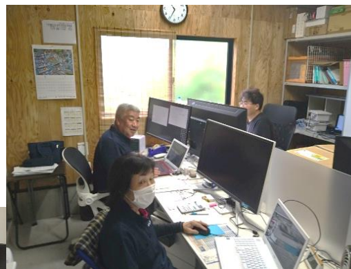
従業員が仕事をする様子

年に1回実施している健康診査。胃がん検診と大腸がん検診も受けられるように検診項目を上乗せしており、従業員の健康管理に努めています。