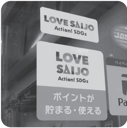
ポイントが使えるお店の目印

A LOVE SAIJOポイント取り扱い店舗の拡充を図っており、現在、デジタル石鎚藩札を取り扱った395店舗のうち152店舗が加入手続きを進めている。今後は、飲食店などへ働きかけるなど、消費者のニーズに応え、さまざまな店舗で利用可能となるよう、引き続き取り扱い店舗の拡充に取り組むこととしている。