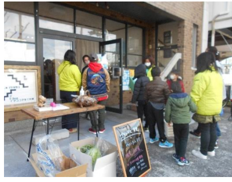
【 テイクアウトでのお持ち帰り 】