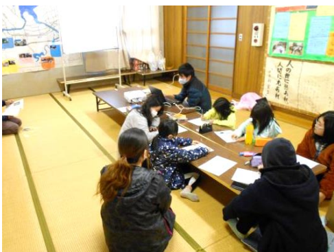
〈神戸コスモス子ども会:武左衛門の学習会〉

大町子ども会(竹の子会、友の会ジュニア、会館友の会)では、今年度は視察による研修は叶いませんでしたが、このような状況だからこそ、『大町子ども会の「これまで」と「これから」』というテーマで、一人一人がこれまでの活動を振り返り、これからどのような「大町子ども会」にしていきたいか、そのために自分やみんなでどのようにしていきたいか、などについて自分の思いや考えをまとめました。このテーマについては、閉講式で意見交流する場を設けたいと考えています。