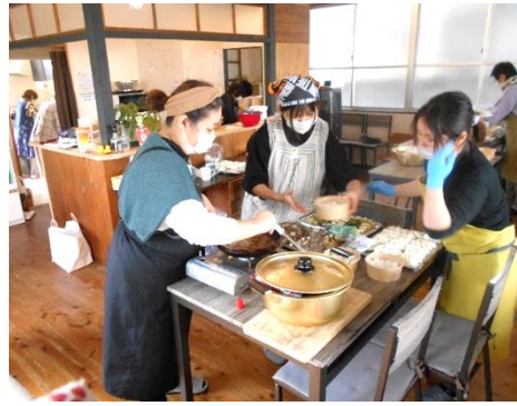
【 子ども食堂調理準備中 】

運営資金のことや活動日、その内容、スタッフ等々、いろいろな質問や疑問に思われることが多々あるかと存じます。詳しくは、大町会館まで連絡いただくか、ぜひ一度「イマココ子ども食堂」へお立ち寄りください。子どもたちを「地域で育む」ために、私たちにできることは何かが見つけられるかもしれません。