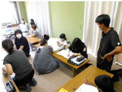
〈大町子ども会:夏休みの学習会〉

今年度も、昨年度に続いてコロナウイルスの猛威による深刻な状況下ではありましたが、「だからこそ何ができる」の視点で、子ども会活動に取り組んできました。今年度のこの学びも、「With コロナの子ども会活動」を継続しながら、次年度に繋げていきたいと思えます。