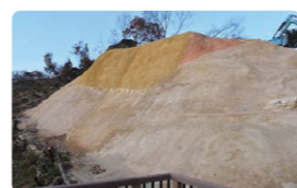
(左)南東部城壁線 (右)復元土塁▶