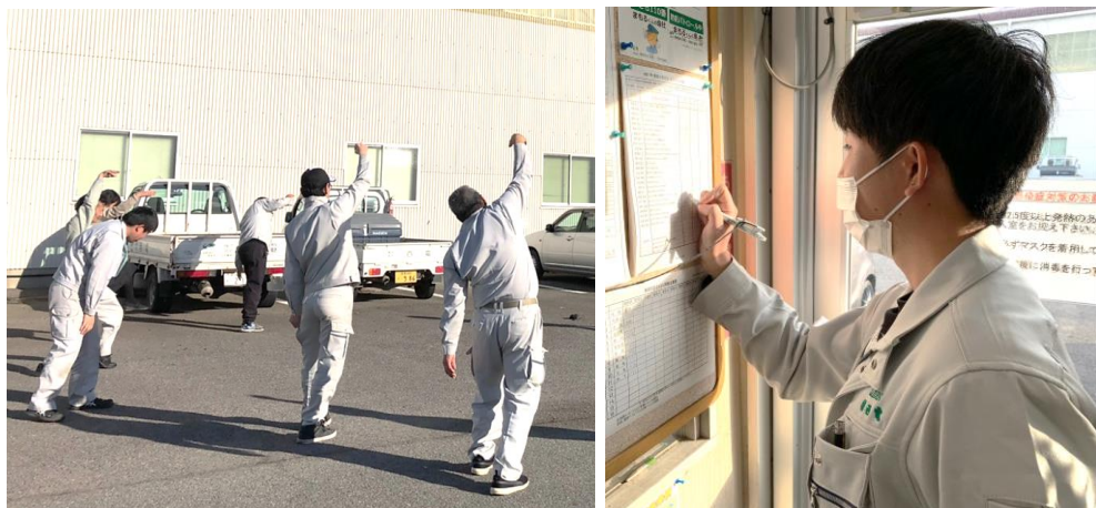
(左)健康づくりでヨガをしている社員 (右)目標達成の評価をしている社員

社員の目標は「毎日階段を一往復」、「1週間に10km歩く」など様々。一人ひとりが持続可能なものを考え継続してもらうことで、毎日健康意識を持ってもらうことを狙っています。