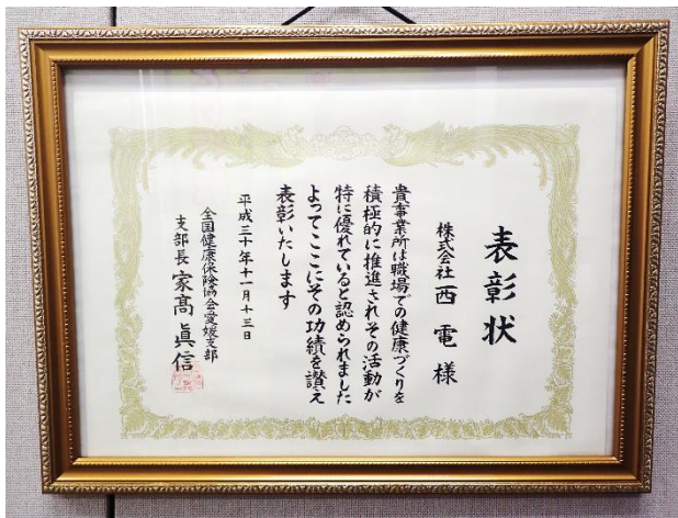
健康づくり優良事業所として愛媛支部長より表彰

賞によって基準も様々ですが、中には「これは甘いんじゃないですか?」と社員から言われるものもあり、社員の健康意識や取り組みに対するモチベーションが上がっていることを実感します。