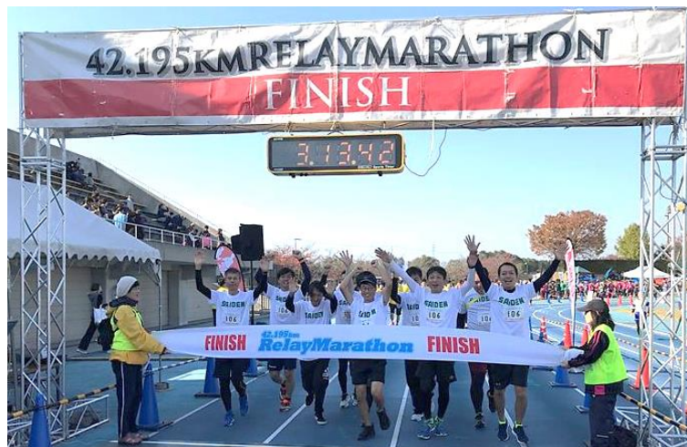
家族が応援する中、健康づくり活動としてリレーマラソンに参加