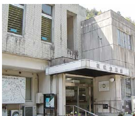
桜樹出張所(現出張所)