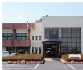
石根出張所(現出張所)