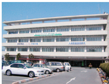
東予総合支所(現市役所)