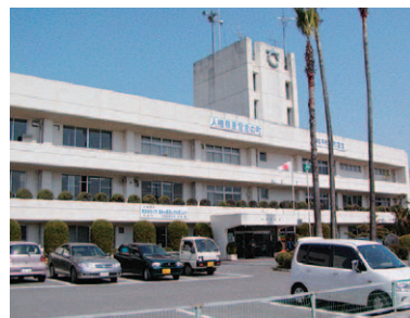
丹原総合支所(現町役場)