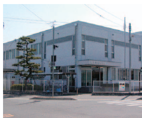
三芳出張所(現支所)