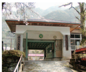
大保木出張所(現支所)