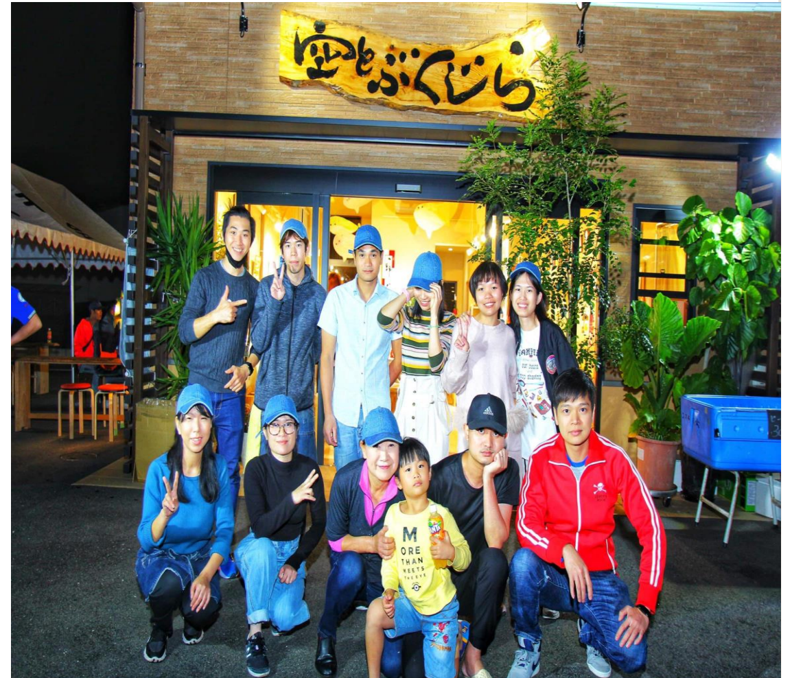
去年10月に実施したイベントのスタッフ