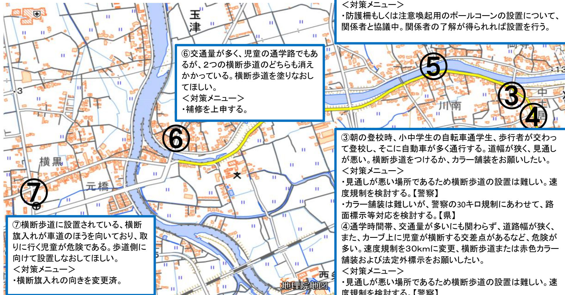
玉津小学校通学路対策箇所図②