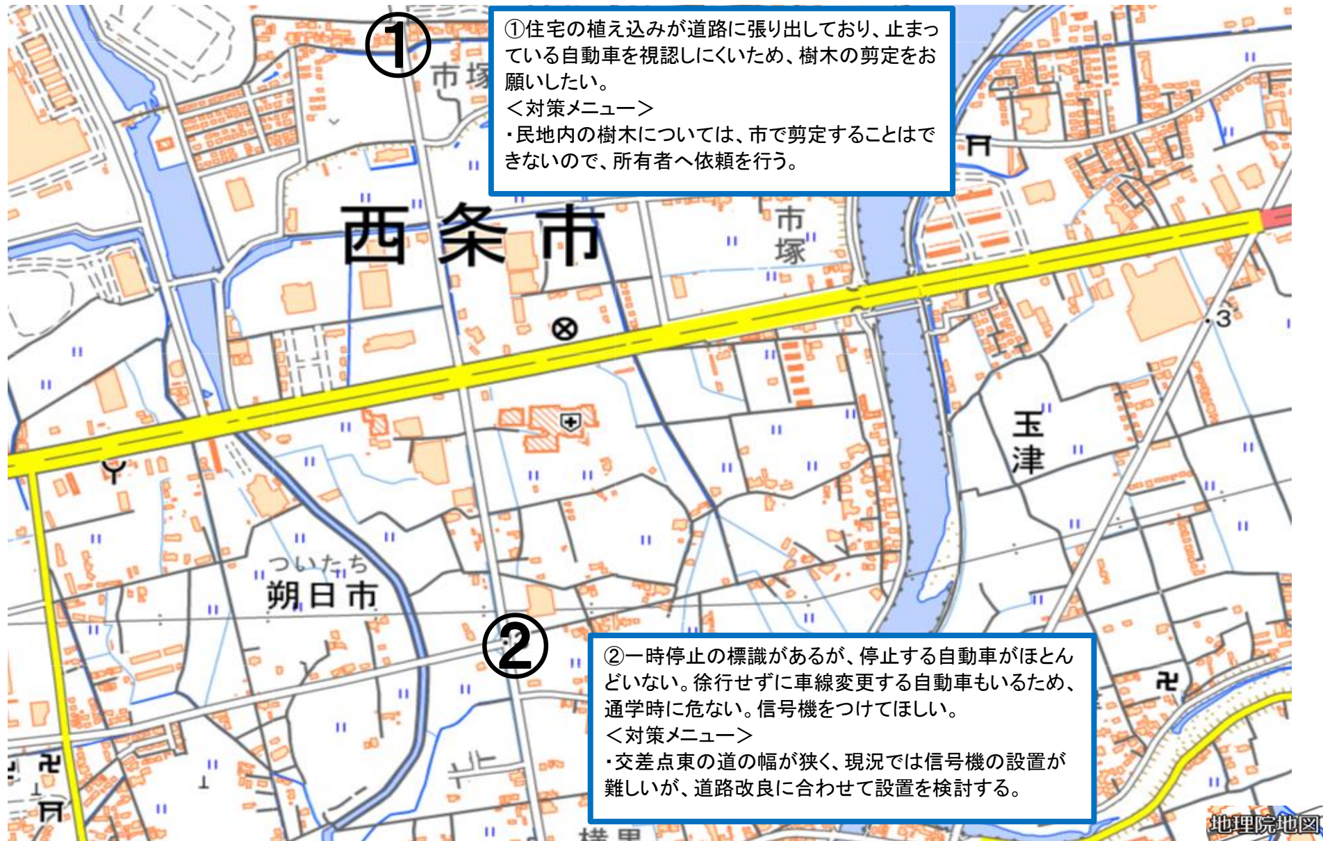
玉津小学校通学路対策箇所図①