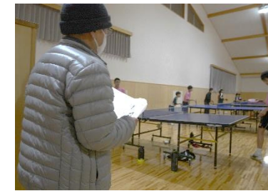
2Fに上がって、2Fも確認