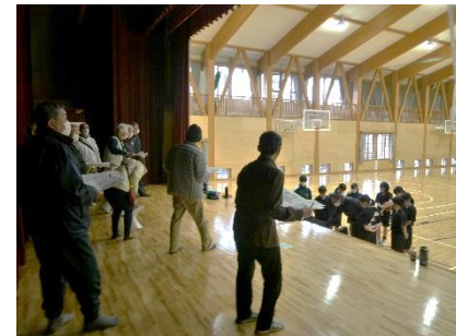
みなさん熱心に見学

西条南中学校の体育館は、平成30年に建て替えられ、体育館内を見たことが無い人が多いことから、連合自治会役員や自治会長など12名が参加して見学しました。