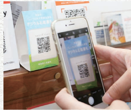
地域消費喚起対策事業