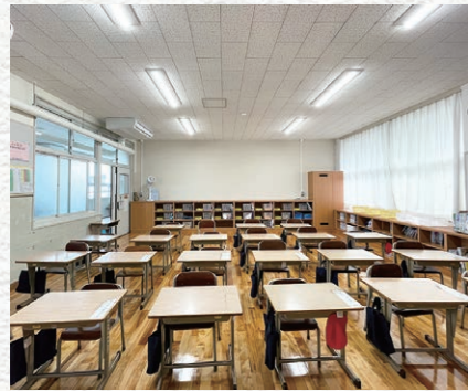
小学校長寿命化（飯岡小学校）