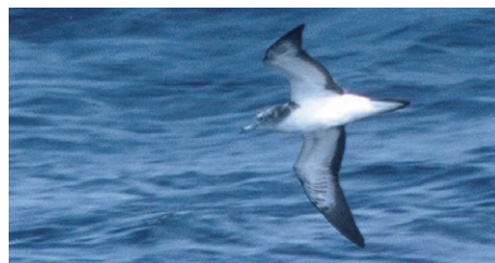
オオミズナギドリ (迷鳥)

全長49cm、外洋性の海鳥で瀬戸内海では見る機会の少ない鳥です。翼上面は灰褐色、下面と腹は白のが特徴です。長い翼を傾けて波間の風を利用して海面を低く飛びます。西条では1998年11月に西ひうちで落鳥が発見され、剥製にして総合科学博物館に収蔵。2008年11月には高須海岸沖で観察、撮影されたほか、数例の観察記録があるだけの迷鳥です。