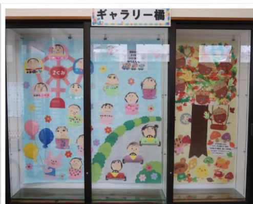
▲9/16~30 2組とあひる・ひよこ組