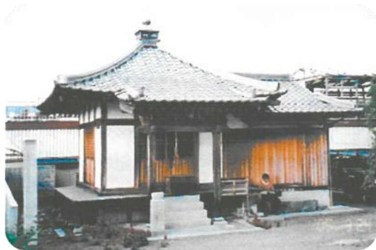
写真上；観音堂（坂元）

奈良から平安時代にかけて、観音菩薩や地蔵菩薩に対する信仰が高まってきます。観音信仰は現世での利益や幸せを求める信仰であり、地蔵信仰は来世での極楽浄土を願う信仰であると言えます。普通私達が「観音さま」とか「観音菩薩」と呼んでいる信仰対象の正式の名は、古い中国語訳では「観世音菩薩」で、新しい中国語訳では「観自在菩薩」となっております。いずれにせよ観音は大きな慈悲（いつくしみ）をもって人々を救うのを本願とし、救いを求める者が仏の姿を願えばその姿となってその人の前に現れ、女性の姿を欲する者には女性となってその人を苦しみから解脱（開放）させるのです。