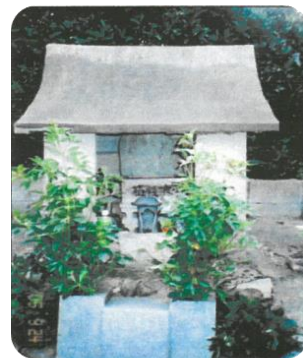
写真上；覚蓮上人廟（北山廃寺跡）

（北山寺は薬師寺や真導寺と同格の寺であったかどうか本格的な発掘調査が待たれます。）