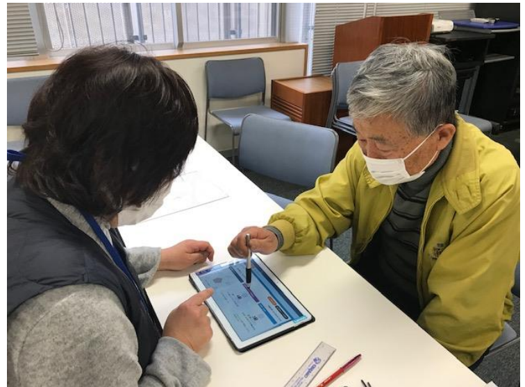
【認知機能チェック項目】